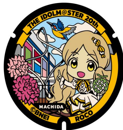
マンホールのデザイン