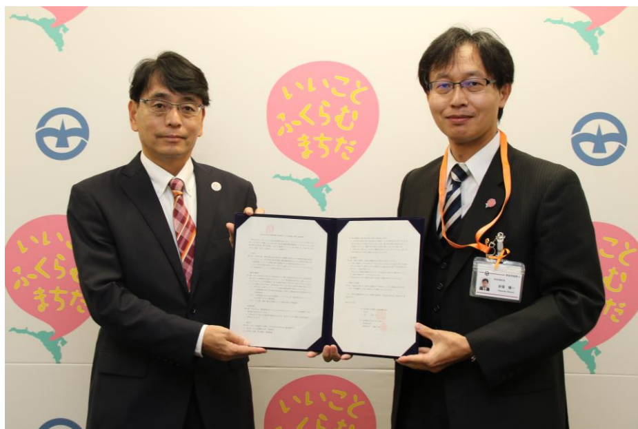
東急株式会社 鈴置プロジェクト開発事業部長

また、このほかに、子育て世帯や高齢者世帯の住宅確保や住宅の耐震化やバリアフリー化に関する情報発信に協働して取り組むことで、多世代住居による持続可能な住環境づくりを推進していきます。