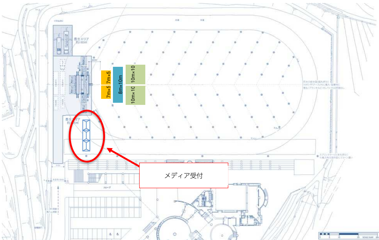
(点火セレモニー会場イメージ図)