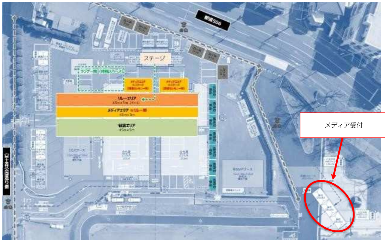
(点火セレモニー会場イメージ図)