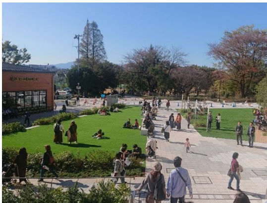
▲まちのオープンスペースとなるプラザ

また、これにより、町田市は、東京都内で2番目となる「プラチナシティ認定自治体」となりました。