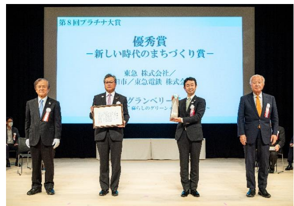
▲プラチナ大賞 授賞式の様子

「南町田グランベリーパーク」は、田園都市線「南町田グランベリーパーク駅」（2019年10月1日に「南町田駅」から改称）南側に広がる鶴間公園と、2017年2月に閉館したグランベリーモール跡地を中心とする約22haのエリアを指し、官民が連携し、都市基盤・商業施設・都市公園・駅などを一体的に再整備・再構築し、自然と賑わいが融合したパークライフを満喫できる「新しい暮らしの拠点」を創り出していくまちづくりプロジェクトが進行しています。