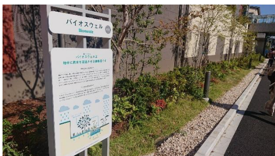
▲雨のみち:バイオスウェル

調整池や雨水貯留槽などの従来型の雨水流出抑制策に加え、自然環境が有する機能を活用するグリーンインフラを採用。敷地周辺を囲むように石を敷き詰めた隙間の多い溝状の「雨のみち:バイオスウェル」と、くぼ地状の植栽帯である「雨のにわ:レインガーデン」をランドスケープのデザインへ取り込みました。