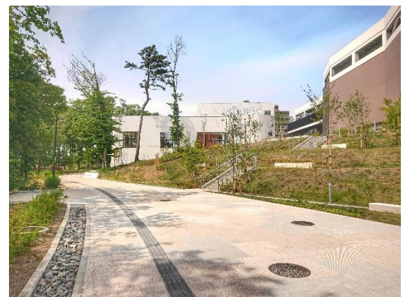
▶(右)商業施設と公園をつなぐ歩行者空間