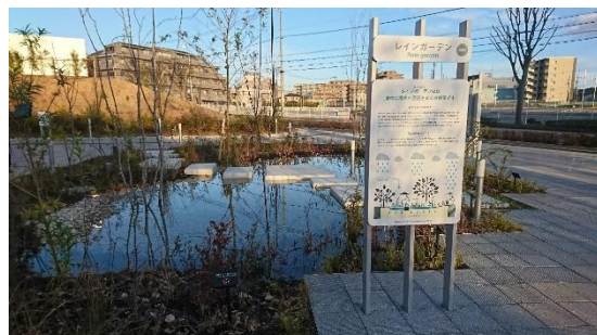
▲雨のにわ:レインガーデン