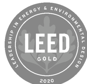
▲LEEDゴールド認証ロゴ※

駅舎建築物としてのゴールド認証の取得、駅舎を含む開発エリアのゴールド認証の取得ともに、国内初です。