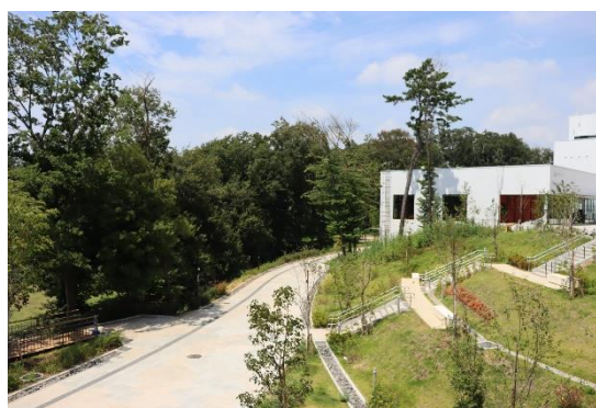
▲シームレスにまちをつなぐパークライフ・サイト通路

※米国グリーンビルディング協会(USGBC)が提供するLEED®は、高性能のグリーンビルディングの設計、建設、維持管理に貢献する評価・認証プログラムです。LEED®およびそのロゴはUSGBCの登録商標であり、使用には許可が必要です。