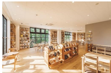
▲まちライブラリー