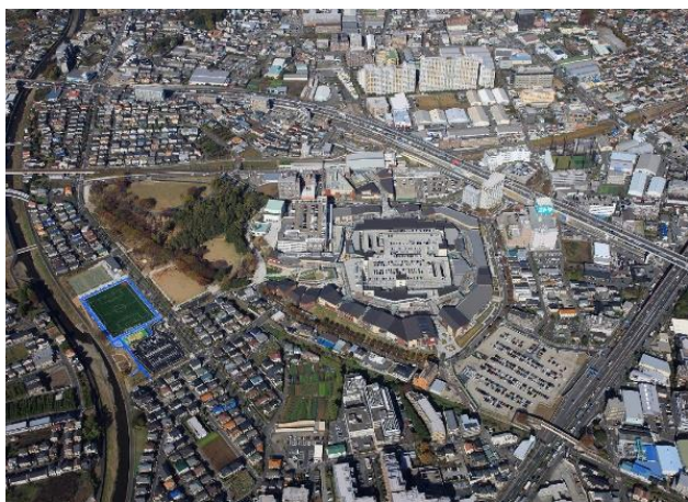
▲「南町田グランベリーパーク」地区全景