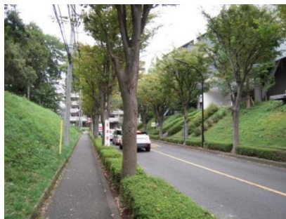
▲南1604号線※2018年6月に廃止