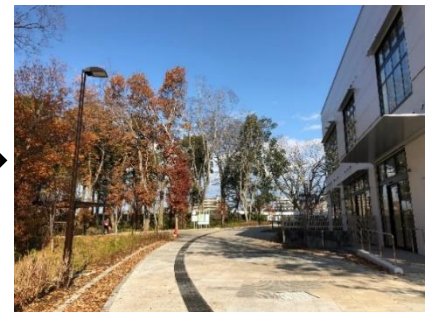
▲パークライフ・サイト内歩行者空間