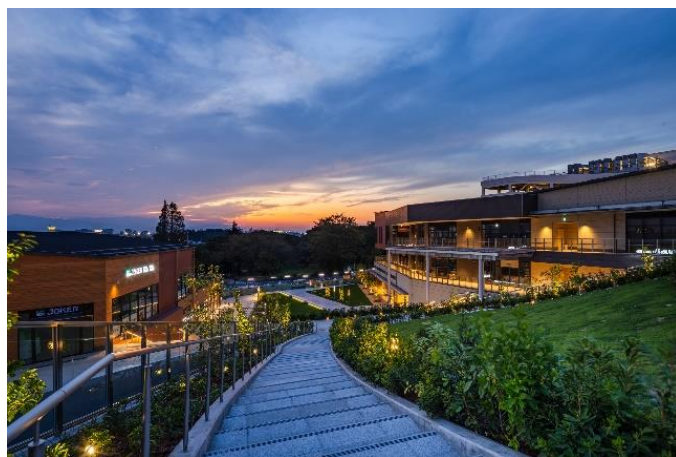
▲グランベリーパーク内広場から見える鶴間公園方向

本プロジェクトは、田園都市線「南町田グランベリーパーク駅」(2019年10月1日に「南町田駅」から改称)南側に広がる鶴間公園と2017年2月に閉館したグランベリーモール跡地を中心とする約22haのエリアについて、官民が連携し、都市基盤・商業施設・都市公園・駅などを一体的に再整備・再構築し「新しい暮らしの拠点」の創出に取り組むまちづくりプロジェクトです。