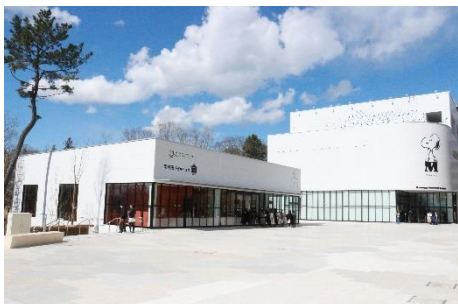
▲パークライフ・サイト (c) Peanuts Worldwide LLC

土地区画整理事業により公園と商業街区との間の道路を再配置した後、公園と商業施設をつなぐ新しいまちの中心エリアを構築するため、町田市宅地 約5,000㎡を換地し、「パークライフ・サイト」と名付けた文化的活動の拠点を創出しました。市民・来街者の多世代が会い、学び、活動できるコミュニティ創生の拠点となることをめざし、株式会社ソニー・クリエイティブプロダクツの事業参画を得て、「スヌーピーミュージアム」を核とし、図書を通じたコミュニティ醸成の場である「まちライブラリー」、児童館「子どもクラブ」など多様な機能が同居しています。また、本棚や椅子などのファニチャーに、整備に伴い公園などで伐採することになった木を活用したことも特徴のひとつです。