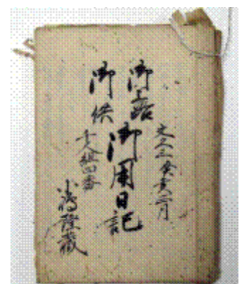
御上洛御供御用日記 （小山町・小島家）