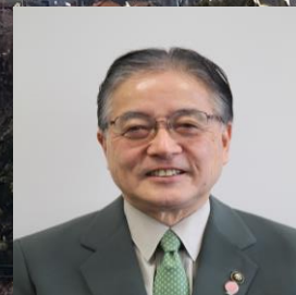
町田市長 石阪 丈一