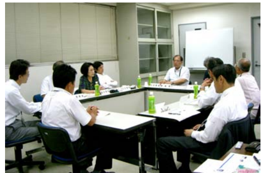
第1回委員会の様子

その後、検討の進め方・スケジュールや対象地の位置づけを確認し、市民アンケート調査の実施や市民意見の募集の方法などについて検討を行いました。