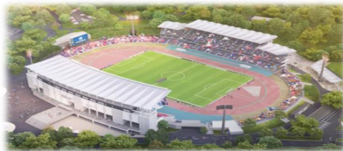
「町田GIONスタジアム観客席増設」イメージ

また、災害に強いまちづくりを推進するため、道路等に面するブロック塀の撤去費用の一部を助成します。