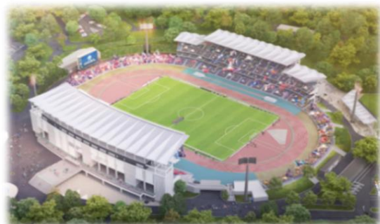
町田GIONスタジアム観客席増設[イメージ]