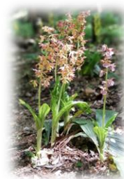
タカネエビネ(町田えびね苑)