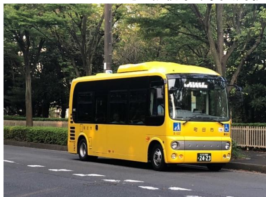
小山田桜台～多摩南部地域病院間運行事業 (小型バス)