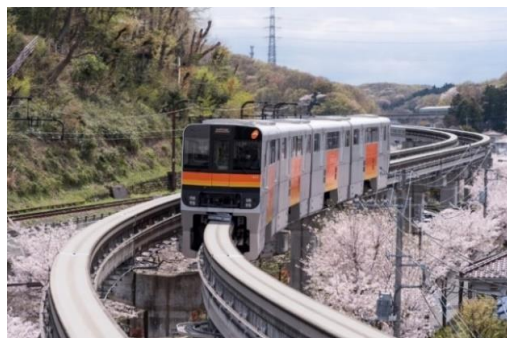
(多摩都市モノレール)

○町田市が選ばれるまちとなるために、多摩都市モノレールの延伸、路線バス網の再編、新たな公共交通サービスの導入検討など、市内の交通基盤の整備に取り組み、移動の利便性を高めていく必要があります。特に、多摩都市モノレール延伸については、早期実現に向けて町田駅周辺や団地再生を含む沿線まちづくりの検討を進めていく必要があります。