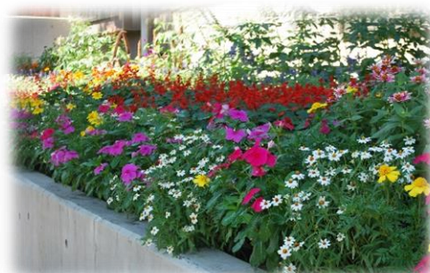
2019年度花壇コンクール 最優秀賞受賞花壇