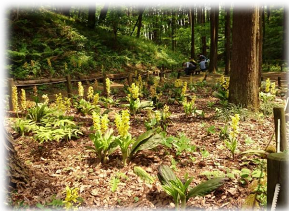
キエビネ(町田えびね苑)