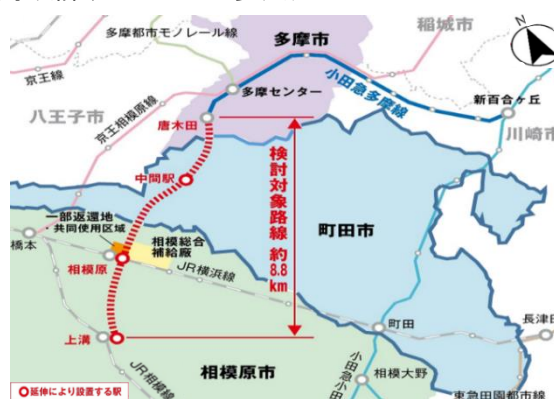
小田急多摩線延伸検討対象路線 (唐木田駅～上溝駅)