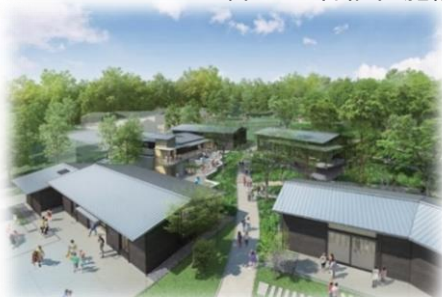
ウェルカムゲート[イメージ]

関連事業 都市農業対策費（経済観光部農業振興課、398ページ参照） 観光事業費（経済観光部観光まちづくり課、405ページ参照） 障がい者福祉施設整備費（地域福祉部障がい福祉課、253ページ参照）