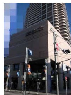
市民フォーラム全景