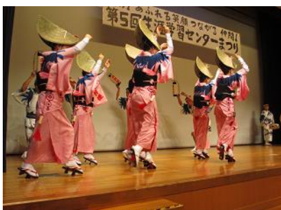
(第5回生涯学習センターまつり)