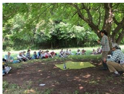
(市民大学自然講座)