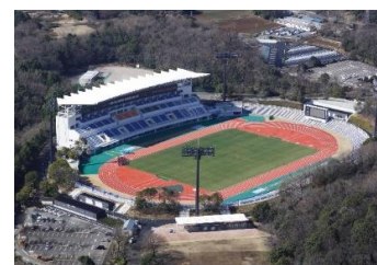
町田市立陸上競技場