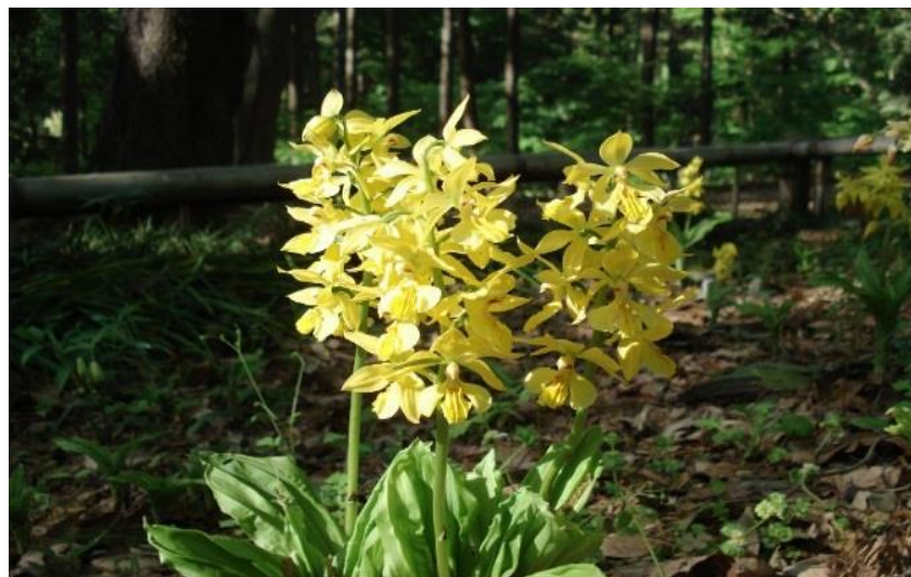
キエビネ (町田えびね苑)