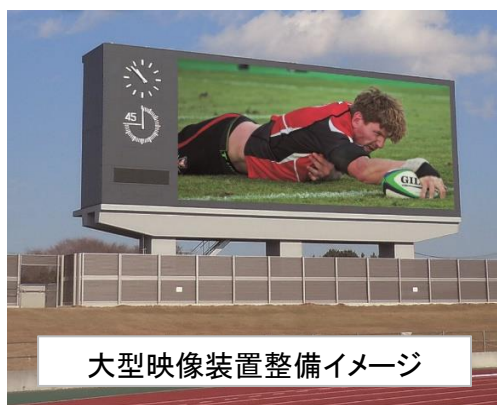
大型映像装置整備イメージ