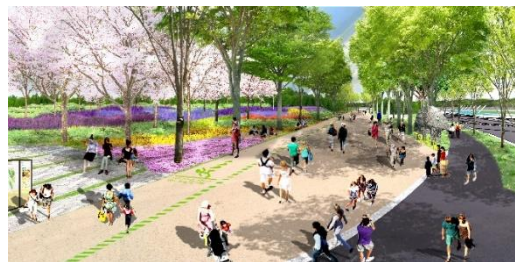
鶴間公園整備後イメージ

「南町田駅周辺地区拠点整備基本方針」に基づき、官民が連携・共同して、鶴間公園と商業施設を中心とした「新たな暮らしの拠点」を創出するまちづくりプロジェクトを実施します。2017年度は、土地区画整理事業の施行、鶴間公園再整備の実施設計などを進めます。