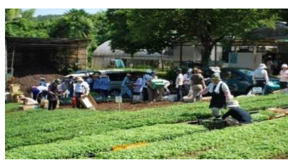
秋の花壇コンクール用苗の配布風景

春及び秋の花壇コンクールで約330団体の中から、それぞれ約50団体が受賞しています。