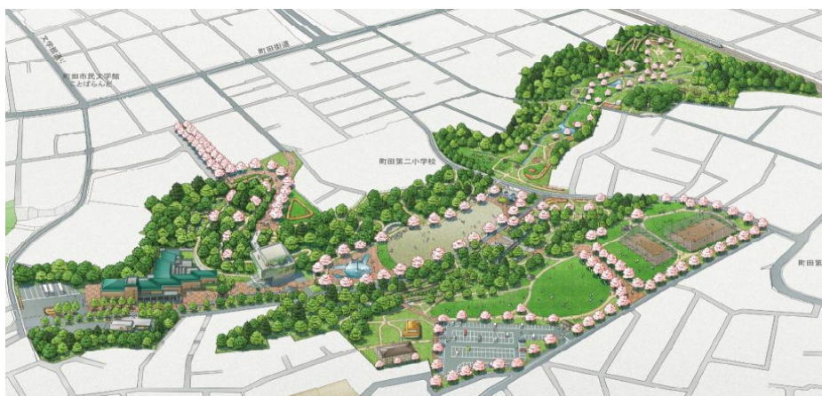
芹ヶ谷公園再整備基本計画鳥瞰図

関連事業 都市計画事務費(都市づくり部都市政策課、451ページ参照) 博物館事業費(文化スポーツ振興部文化振興課、193ページ参照)