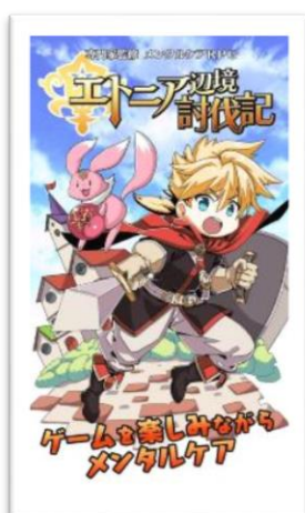
株式会社ブリッジ メンタルケアRPG 『エトニア辺境討伐記』