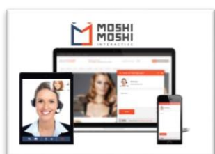
ニューロネット株式会社 映像型コールセンターシステム 『Moshi Moshi Interactive』