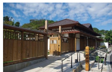
小野路宿里山交流館