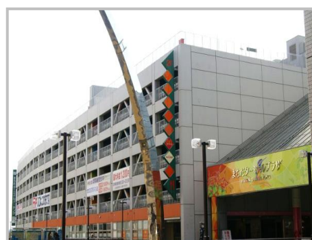
町田ターミナルプラザ