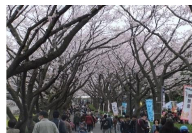
町田さくらまつり