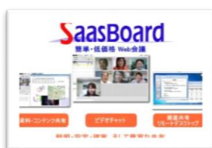
ニューロネット株式会社 プライベートクラウド型 Web 会議システム 『SaasBoard』