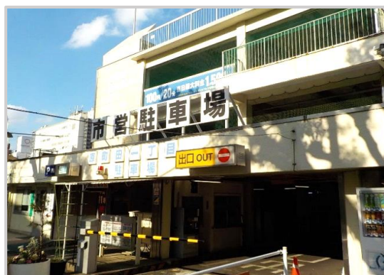
原町田一丁目駐車場