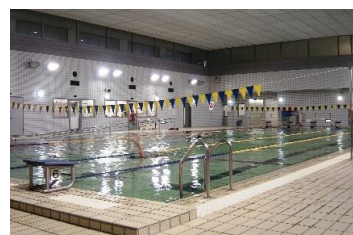
南中学校温水プール