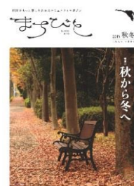
地域情報誌「まちびと」 2015年11月号