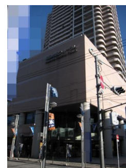
市民フォーラム全景