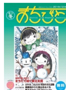
地域情報誌「まちびと」