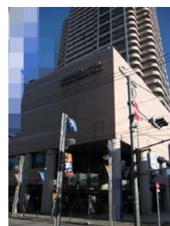
市民フォーラム全景