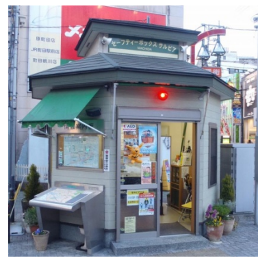
民間交番 「セーフティボックスサルビア」

主な事業費 民間交番運営費補助金 3,000千円 防犯協会補助金 1,026千円