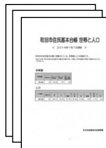
『住民基本台帳 世帯と人口』 毎月発行