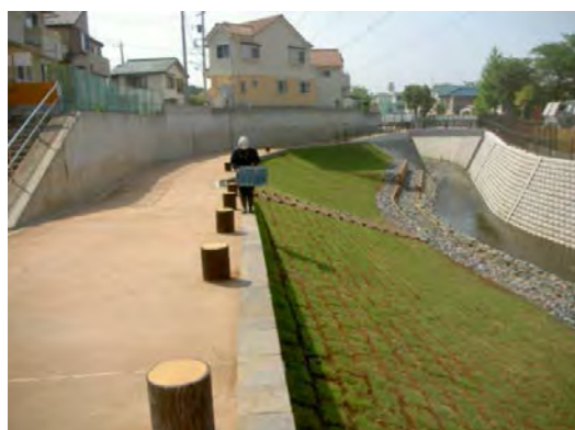
親水機能を取り入れた雨水幹線工事 (小野路1号雨水幹線)