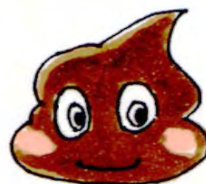
町田市下水道キャラクター「ベン」