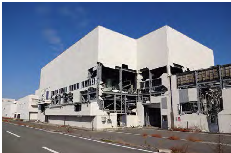
東日本大震災で被災した気仙沼終末処理場