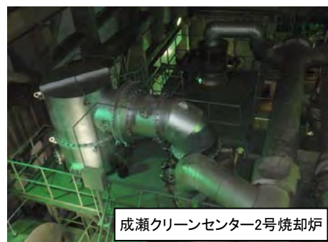
成瀬クリーンセンター2号焼却炉