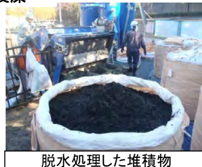
脱水処理した堆積物