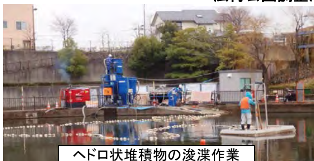
ヘドロ状堆積物の浚渫作業