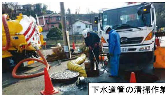
下水道管の清掃作業