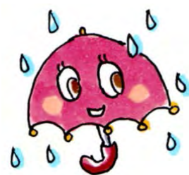
町田市下水道キャラクター「アメリ」

主な特定財源 公共施設整備等基金繰入金 170,000千円 市町村総合交付金(都) 110,000千円