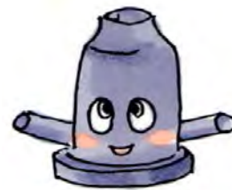
町田市下水道キャラクター「ホールマン」

主な特定財源 下水道使用料 2,666,954千円 下水道費補助(都) 9,366千円