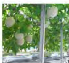
町田式水耕栽培槽