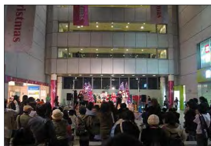
ターミナル市民広場のイベント ～町田ミュージックパーク