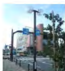
消えないまちだ君