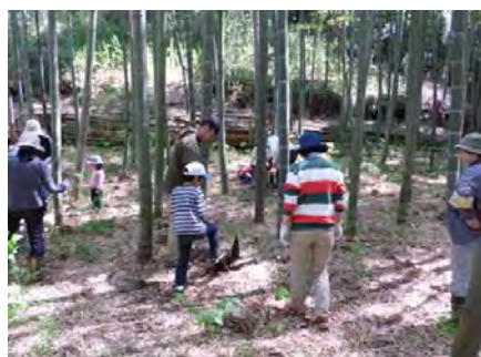
親子タケノコ掘体験

主な事業費 里山環境整備事業委託料 13,000千円 源流域・奈良ばい維持保全整備委託料 ・対象面積 源流域:3.6ha 奈良ばい谷戸:1.5ha 基本計画作成委託料 11,000千円 里山環境維持保全計画作成委託料 ・対象面積 源流地域:40ha 奈良ばい周辺地域:20ha 北部丘陵整備工事費 8,500千円 農道整備工事費 ・整備箇所 2箇所 ・整備延長 320m(幅員1.8m)