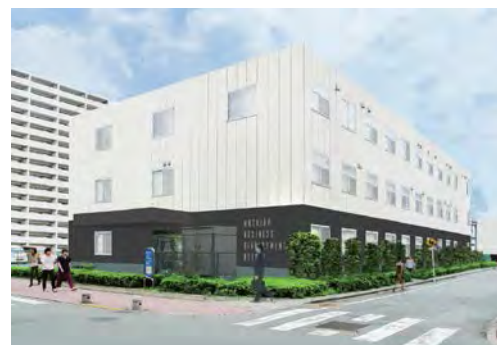
町田新産業創造センター