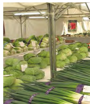
農業祭野菜品評会