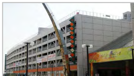
ターミナルプラザ