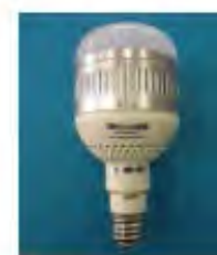
水銀灯代替LEDランプ SN400ADF2