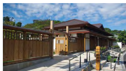
小野路宿里山交流館