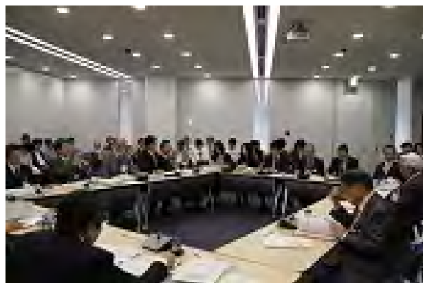
町田市行政経営監理委員会