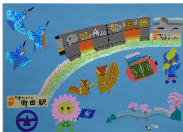
モノレール絵画コンクール 市長賞(一般の部)作品