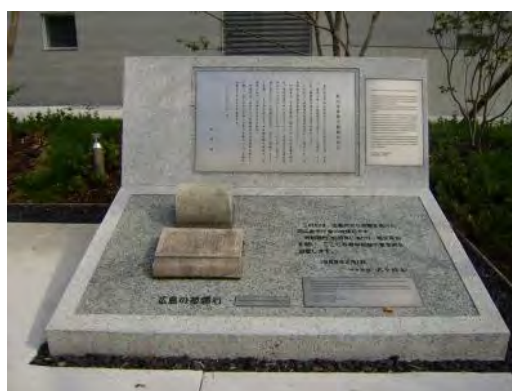
町田市非核平和都市宣言碑