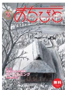
地域情報誌「まちびと」 2012年12月号