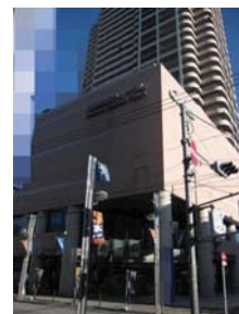
市民フォーラム外観