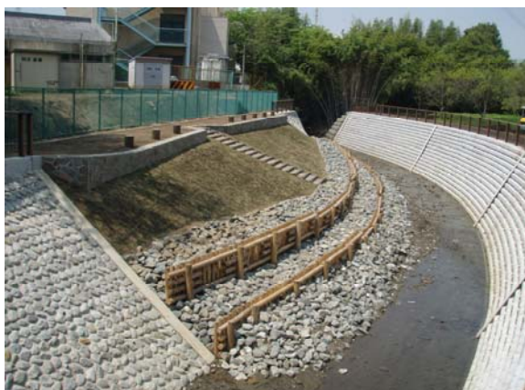
【小野路1号雨水幹線親水施設:鶴川第一小学校裏2008年度竣工】

浸水対策とともに、水に親しめる空間の創造に向け、小野路1号雨水幹線の親水施設「井の花堰周辺」の整備を行います。