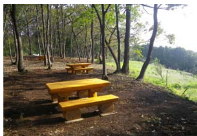
地域住民や散策者の憩いの場「見晴らし木陰広場」が完成しました。