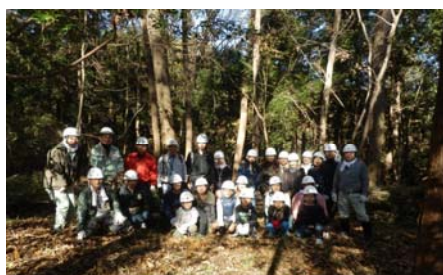
地域の児童・保護者、地権者等を中心に「小山田の森づくり」に取り組んでいます。