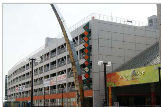
ターミナルプラザ