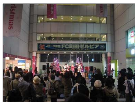
ターミナル市民広場のイベント～町田ミュージックパーク