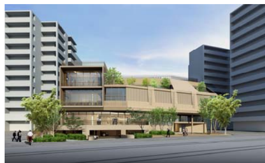
「鶴川緑の交流館」の完成予想図 鶴川駅前連絡所は館内1階に設置