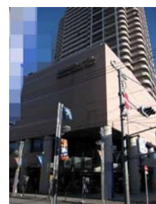
市民フォーラム全景