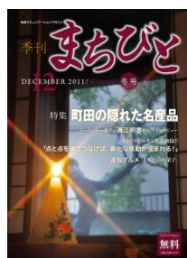
地域情報誌「まちびと」 2011年12月号