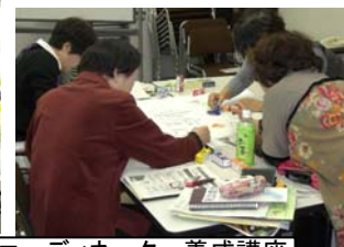
生涯学習コーディネーター養成講座