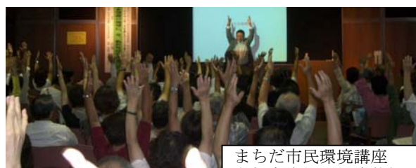
まちだ市民環境講座 参加者全員と健康体操