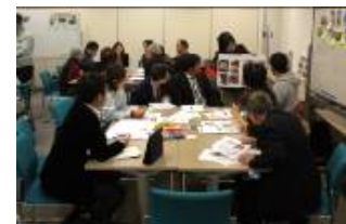
景観づくりセミナーの様子