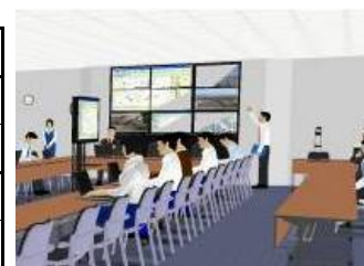
(防災センターイメージ)