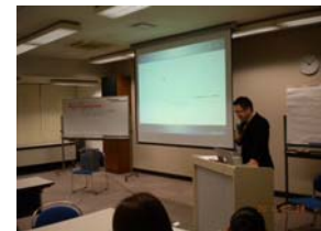
景観づくりセミナーの様子 ※ガイドラインの検討を行うにあたり、セミナーや社会実験を行います。