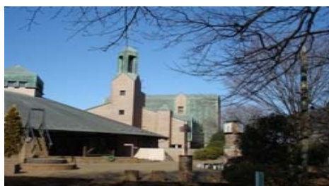
250人収容のカリヨンホール