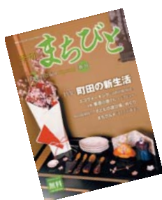
地域情報誌「まちびと」 2010年3月号