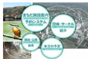
施設予約システム