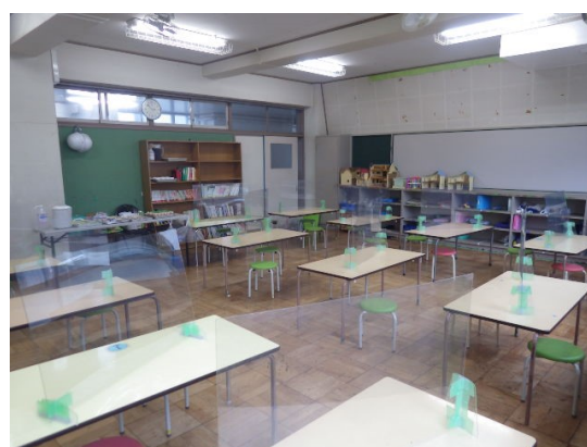
◆改修する町田第三小学校区の竹ん子学童保育クラブ