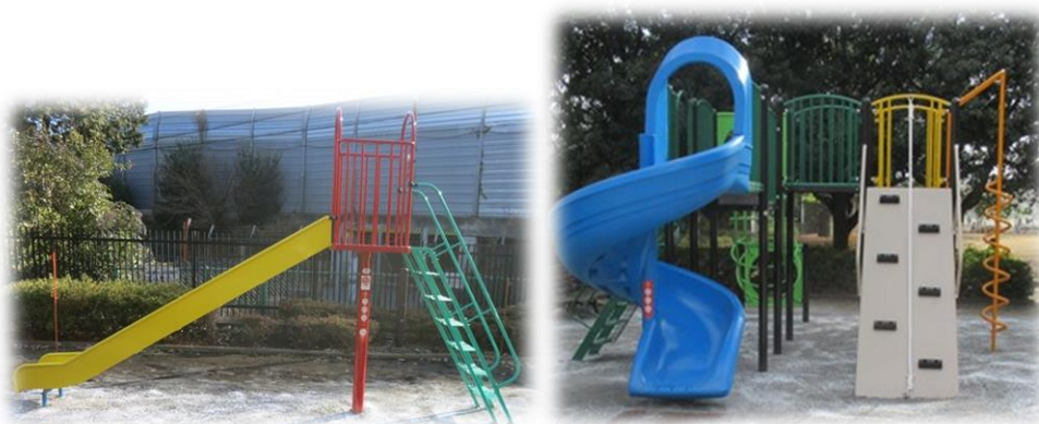
更新されて新しくなった遊具