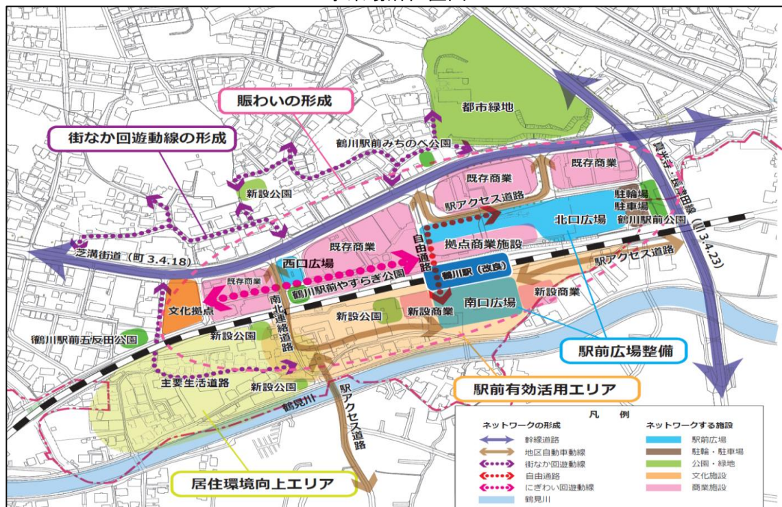
② 鶴川駅周辺街づくり事業概要図