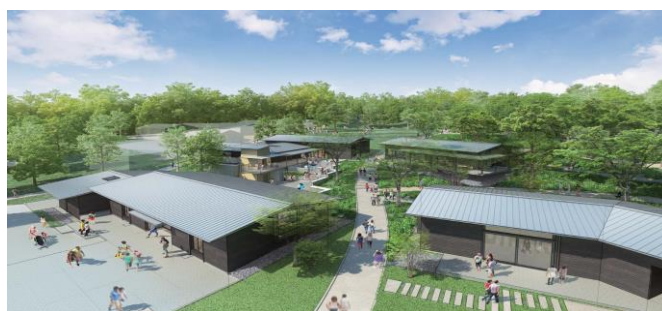
町田薬師池公園四季彩の杜ウェルカムゲート外観 イメージ