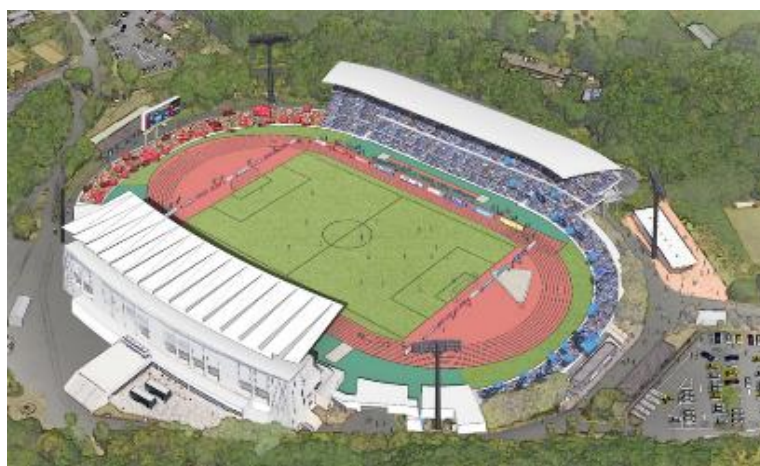
観客席増設整備イメージ