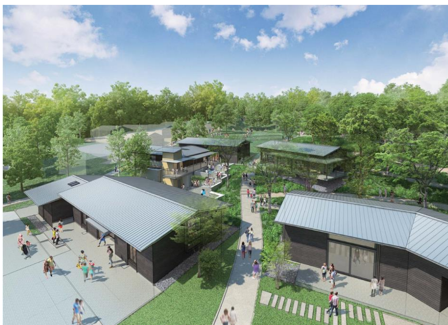
町田薬師池公園四季彩の杜ウェルカムゲート 外観イメージ

自然の中で楽しむ総合スポーツパークを目指し、2014年5月に策定した「第二次野津田公園整備基本計画」に基づき、公園北側の拡張区域に整備する多目的グラウンド及びテニスコートの実施設計を行います。また、町田市立陸上競技場の観客席増設に伴う造成工事を行います。