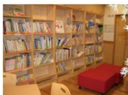
図書情報コーナー

横浜市では地域の人々の身近な地域活動や生涯学習の場として、コミュニティハウスを学校施設内や既存施設を活用して設けています。このうち、東山田中学校では、神奈川県で初めて地域住民や保護者などが一定の権限を持って学校運営に参画し、地域に開かれた学校「コミュニティスクール」として2005年に開校しました。中学校の中庭に面した市民利用施設—コミュニティハウスは、地域住民が自らの活動の場を住民自身の手で運営し、地域住民の生涯学習や地域活動の場を身近に確保するとともに、学校と地域との交流・連携を深めています。