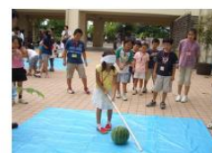
夏休みの小学生キャンプ 中学生のボランティア活動