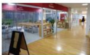
指定管理者が設置した 利用者のためのカフェ