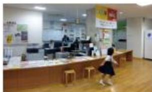
指定管理者が常駐する受付

石川県かほく市宇ノ気体育館は、市立宇ノ気中学校の体育館と市民が利用する社会体育施設の機能を兼ねた施設です。指定管理者として総合型地域スポーツクラブが管理運営を行っており、授業や部活動にも総合型スポーツクラブが協力するなど連携による学校の教育活動の活性化等の効果が生まれています。