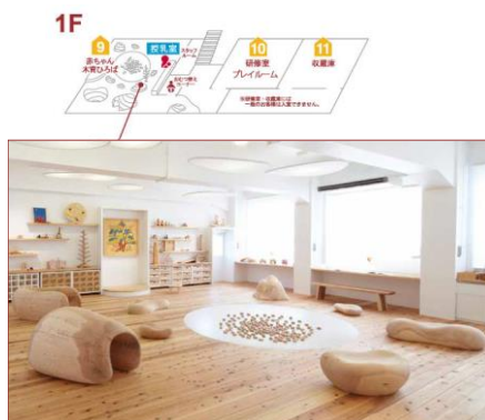
NPO 法人が運営する、 廃校を活用した東京おも ちゃ美術館

東京都新宿区の旧四谷第四小学校同幼稚園の活用策を区地元町会で検討した結果、2008年にNPO 法人が運営する東京おもちゃ美術館などが開館しました。入館料以外にも「一口館長制度」に基づく寄付の採用やボランティアスタッフである「おもちゃ学芸員」によって成り立っており、遊びと人をつなぐ「おもちゃ学芸員」がいることで、子どもだけではなく親などにとっても豊かな出会いと楽しいコミュニケーション環境を提供しています。