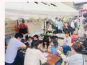
顔写真入りオリジナル缶バッジ製作

ました。 今後も、各地域で公共施設の再編について、楽しく、分かりやすく紹介していきます。