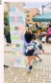
巨大ジェンガクイズ