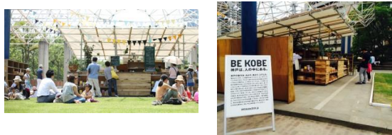
本棚が置かれた公園