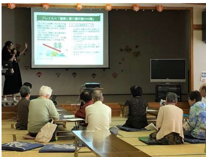
出前講座の様子(ふれあい桜館)

今回の監査においては、9月19日にふれあい桜館で実施した出前講座に赴いて、実施状況を確認した。その時の様子(写真)は次のとおりである。