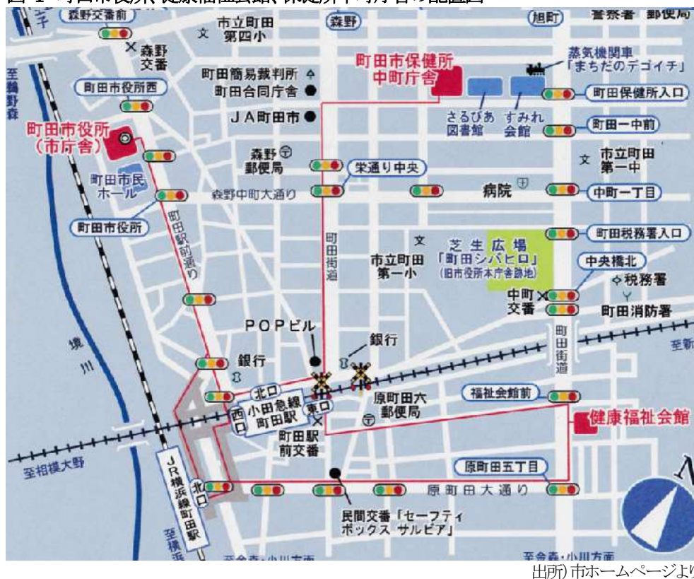
図 1 町田市役所、健康福祉会館、保健所中町庁舎の配置図

上記のとおり、東京都町田保健所から移譲された保健所中町庁舎は築 40 年以上、健康福祉会館は築 30 年以上経過しており、今後も、施設を現状のまま維持した場合、老朽化によって維持管理費用の増加が見込まれるところであるが、さらに、上図のとおり、近隣に保健所関連施設が配置されていることによる保健所施設の統合といった課題もある。