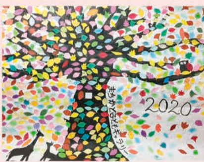
2020年のコメントツリー

市庁舎で予定されていた来場者のコメントを樹木の形に仕上げたコメントツリーの展示（金井中学校美術部制作）は、残念ながら緊急事態宣言の再発令により中止となりましたが、11月頃、またみなさんに子どもたちの作品をお届けしますので、楽しみに！！