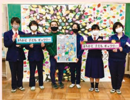
金井中学校美術部の生徒さんと顧問の先生

予想以上にコメントが集まり驚きました。コメントのひとつひとつに愛が詰まっていて、制作しながらあたたかい気持ちになりました。地域の方々に個性あふれる作品の数々を楽しんでもらえたことや地域の色々な場所や魅力を知ってもらえたことがうれしいです。