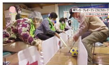
棒サッカーで地域を元気に大作戦