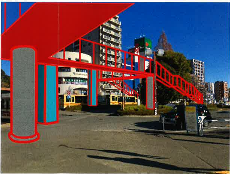
③ 計画予定地の現況