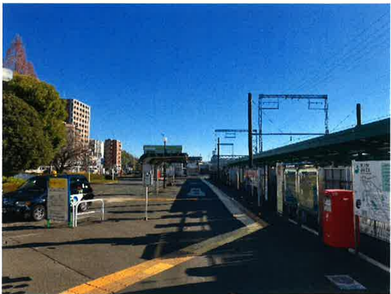
② 現況のバスシェルター