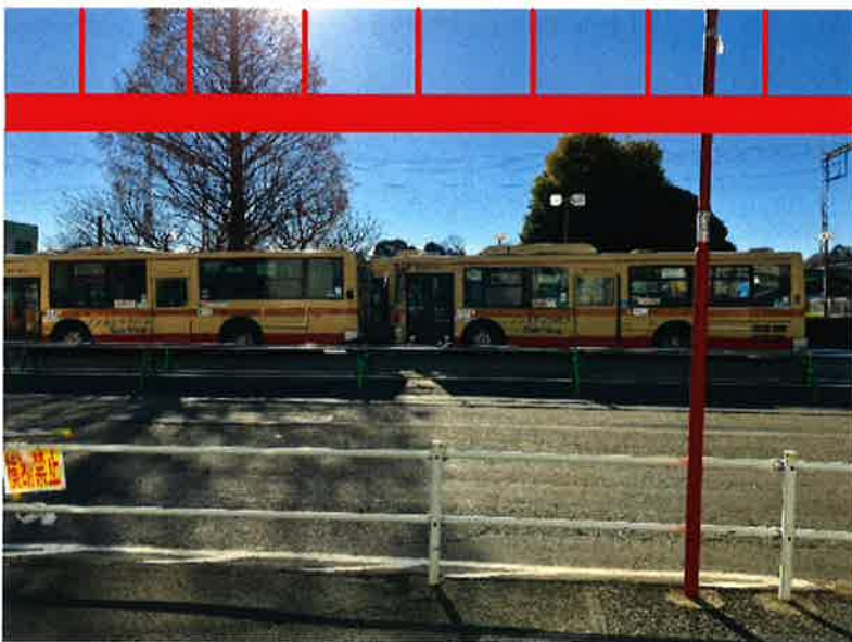
⑦ 現況のバスロータリー