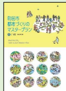
町田市都市づくりのマスタープラン