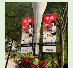
エリアマネジメント広告

○脱炭素化やIoTの発展等により、景観への影響を及ぼすソーラーパネルや通信アンテナ基地などが増加。