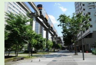
モノレールルート沿線のまちづくり事例(立川市サンサンロード:景観重要公共施設)