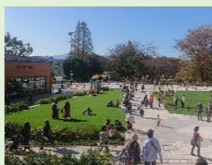
南町田グランベリーパーク 「土木学会デザイン賞 2021」において優秀賞を受賞 第1回グリーンインフラ大賞「都市空間部門」において、優秀賞を受賞