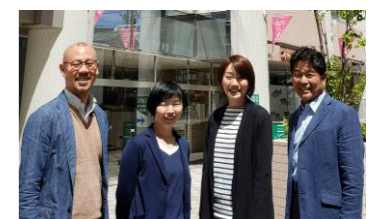
地域活動サポートオフィス