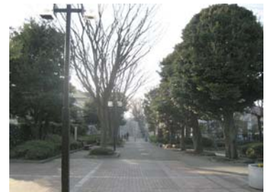
つくし野パークロード