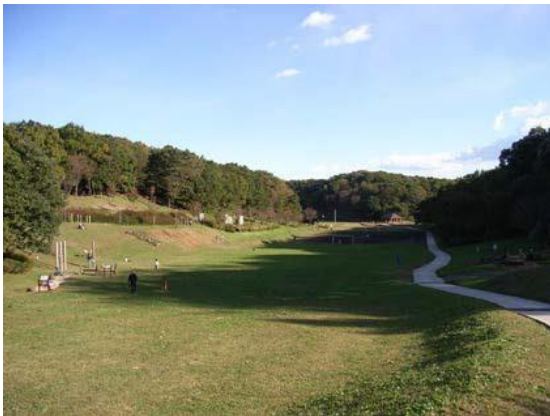
多くの人が憩う都立小山田緑地