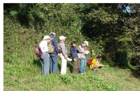
まち歩きの風景（景観市民調査会）