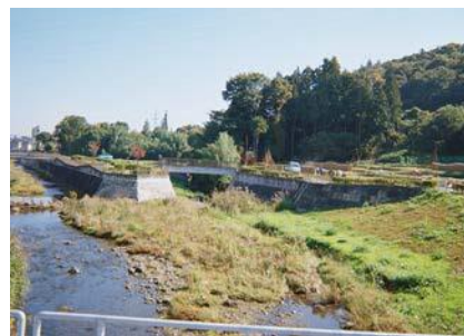
自然の流れに配慮した河川空間