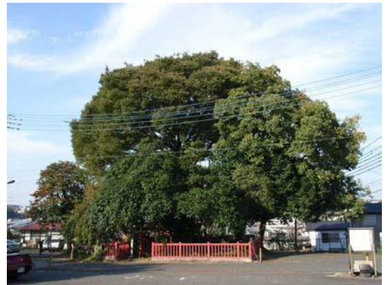
地域の象徴となっている樹木