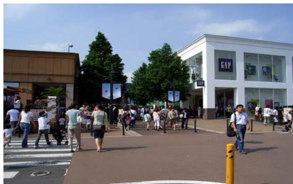
グランベリーモール（南町田駅前）