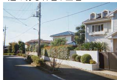
塀の手前に設けた植栽