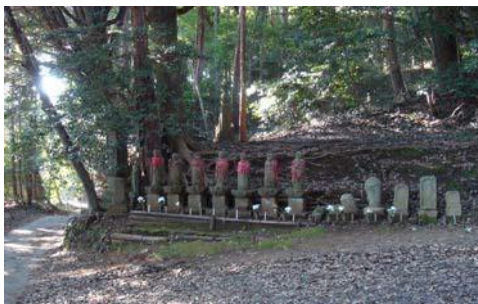
地域の文化や歴史を物語る景観資源