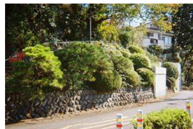
趣のある石垣や生垣