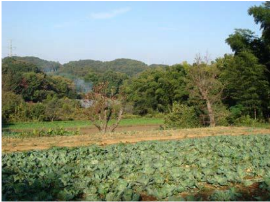
農地と谷戸山の風景