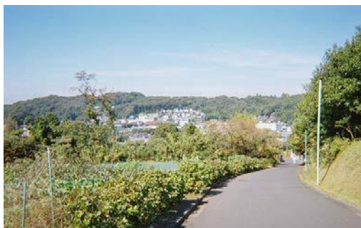
坂道から望む尾根の稜線