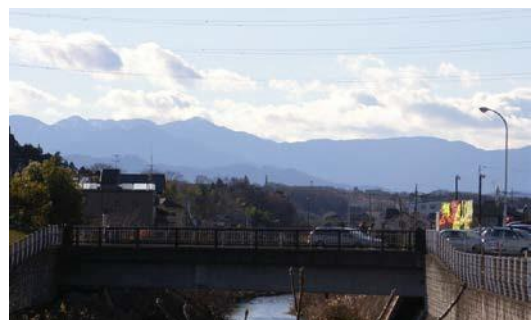
鶴見川から望む丹沢・大山の眺望