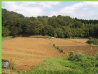
小山田・小野路地域の大規模な農地