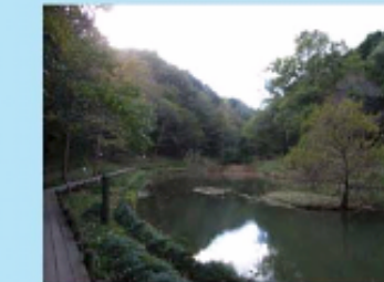
都立小山田緑地の湧水と池