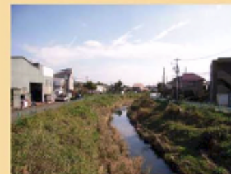
低地を流れる河川