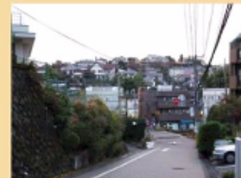
丘陵地沿いの住宅地