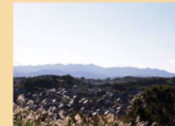
都立小山田緑地本園見晴らし広場からの眺望

・多様な地形を有する町田市では、低地と台地の境や丘陵地での尾根部分などの空間の開けた場所から、丹沢・大山の山並みや丘陵の緑の尾根線などさまざまな眺望がみられる。