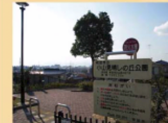
小山見晴らしの丘公園

・多様な地形を有する町田市では、低地と台地の境や丘陵地での尾根部分などの空間の開けた場所から、丹沢・大山の山並みや丘陵の緑の尾根線などさまざまな眺望がみられる。