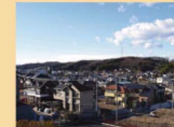
野津田付近の丘陵の尾根の稜線