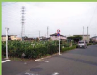
住宅地内の生産緑地

・丘陵地と境川に挟まれた台地部分では、新旧の様々な住宅地と、その周辺の農地等の景観がみられる。