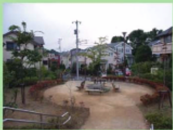
開発に伴いつくられた小公園