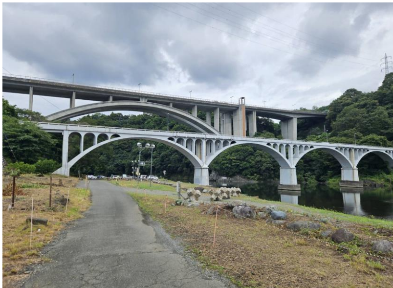
相模原市緑区小倉 付近