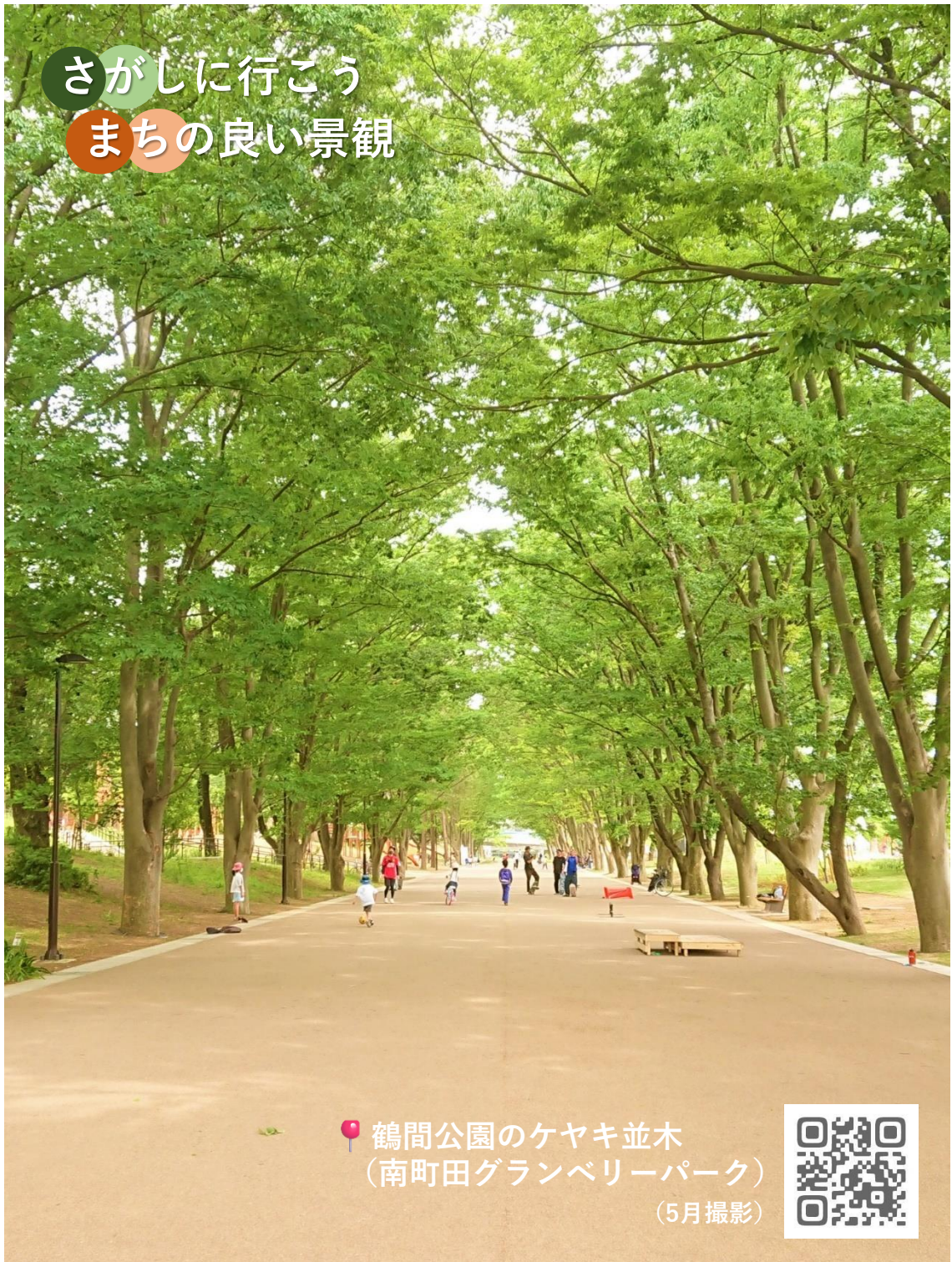
鶴間公園のケヤキ並木 (南町田グランベリーパーク) (5月撮影)