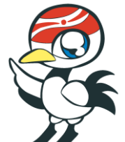
つるちゃん 鶴川商店会マスコット キャラクター