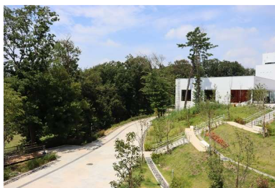
▲シームレスにまちをつなぐパークライフ・サイト通路

※米国グリーンビルディング協会(USGBC)が提供するLEED®は、高性能のグリーンビルディングの設計、建設、維持管理に貢献する評価・認証プログラムです。LEED®およびそのロゴはUSGBCの登録商標であり、使用には許可が必要です。