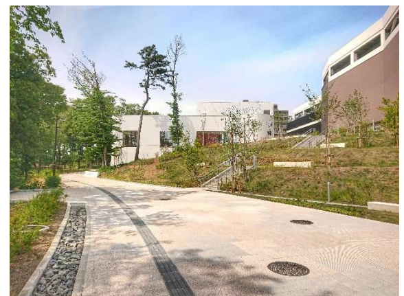
▶(右)商業施設と公園をつなぐ歩行者空間