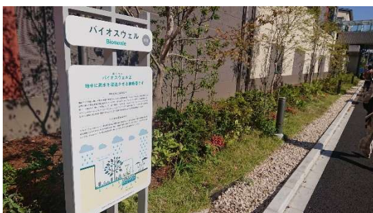
▲雨のみち:バイオスウェル

調整池や雨水貯留槽などの従来型の雨水流出抑制策に加え、自然環境が有する機能を活用するグリーンインフラを採用。敷地周辺を囲むように石を敷き詰めた隙間の多い溝状の「雨のみち:バイオスウェル」と、くぼ地状の植栽帯である「雨のにわ:レインガーデン」をランドスケープのデザインへ取り込みました。