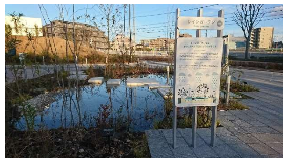
▲雨のにわ:レインガーデン